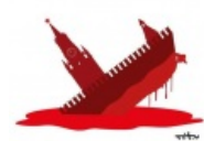
русский военный корабль — иди нахуй

Позже стало известно, что после ракетного обстрела острова и десанта, большая часть из них таки были захвачены в плен. Росийская пропогондня, естественно, начала закапывать мем, нарядив крымского бомжа в форму погранца и заставив каяться и парадно водить хороводы вокруг пленных, но всем уже было похуй на историю.