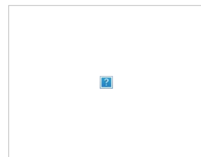
Смелые фантазии на тему