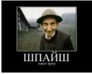
Шпайш машт што?