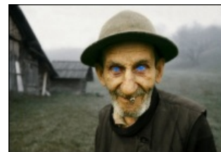
Самая знаменитая картинка со «шпайшом».

Шпайш машт флоу — искаженное английское « spice must flow », мем раздела /b/ на Дваче. Впервые появился в виде картинка старичка с прифотошопленными глазами ибада и подписью «Шпайш машт флоу».