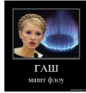
Гаш машт флоу