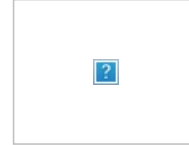
Арташ машт флоу Гашиш машт флоу