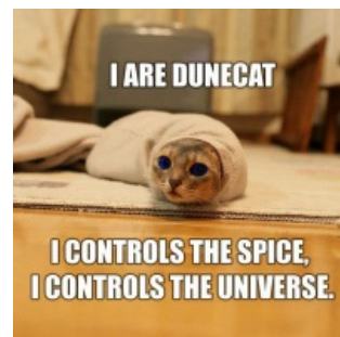
Дюнокот контролирует спайс — контролирует вселенную.

Спайс (англ. spice , он же меланж или меланжа, эликсир, надм. приправа) — специя, пряность является одним из ключевых понятий в романах серии «Дюна» Фрэнка Герберта. Непосредственно выражение « spice must flow », если быть точным, пришло не из оригинальной книги Герберта, а из её экранизации 1984 года Дэвида Линча. Там её произносят, в частности, Навигатор Космической Гильдии и знатный педераст (в изначальном, древнегреческом смысле... да и в обычном тоже) барон Харконнен.