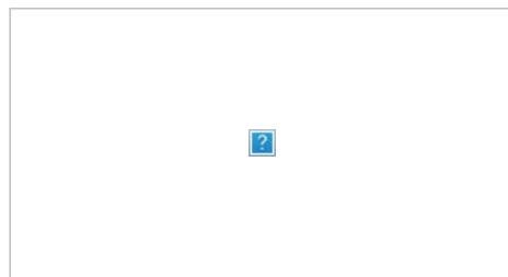
Курс биткоина по отношению к доллару. Скачет.