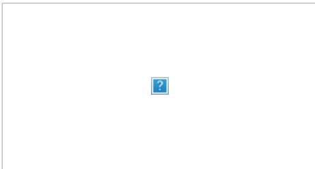
Создание ЭЦП в клиенте биткоина

Программа-клиент bitcoin устроена предельно просто: есть кнопка, позволяющая узнать общее количество своих сбережений, передать деньги кому-то или узнать адрес своего кошелька, чтобы сообщить его тому, кто хочет заплатить вам. Основной ценностью является «бумажник», в котором можно создавать сколько угодно