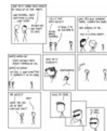
xkcd: Это Рик Этли, детка