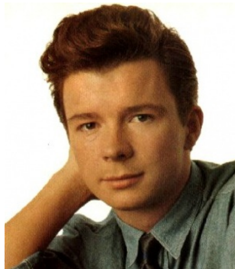
Рик смотрит недовольно, свирепо и в то же время грустно и с недоумением