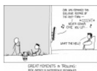
lm_ru:xkcd: Rick Astley rickrolled!