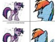
Даже пони, даже Аллах