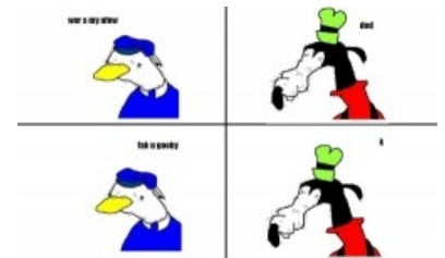
Пример оригинального комикса с форчана