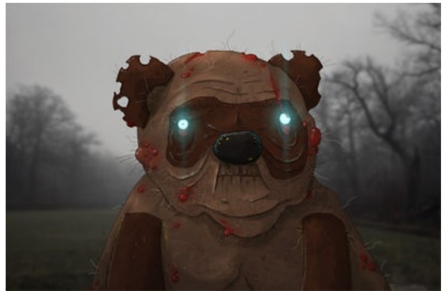
Улучшенная версия главного героя

Вонни и Потачок (или просто Вонни) — практически оригинальный инфернально-наркоманский комикс, самозародившийся в марте-апреле 2012 на сосаче и повествующий о героиновых буднях простого советского медведя. Примечателен помимо собственно экзистенциальной тоски ещё и тем, что, в отличие от большинства мемов и макросов последнего времени, догнал и превзошёл свой форчановский прообраз (комикс Uncle Dolan) как по атмосфере, так и по качеству исполнения. Тем не менее, традиция изображения персонажей и подписей осталась неизменной. Как следствие: двач — торт, анонимус — молодец, интернет — жив, потеря девственности — не за горами.