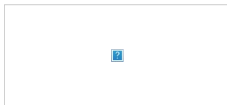
Пафосный Кунг на зелёном экране и в сцене

К сожалению, к 25 января 2014 года ни миллиона, ни 750 тысяч в общаке не оказалось — 17 713