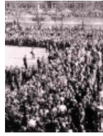
Похороны. Почти как у Высоцкого