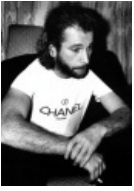
Расслабляется после концерта