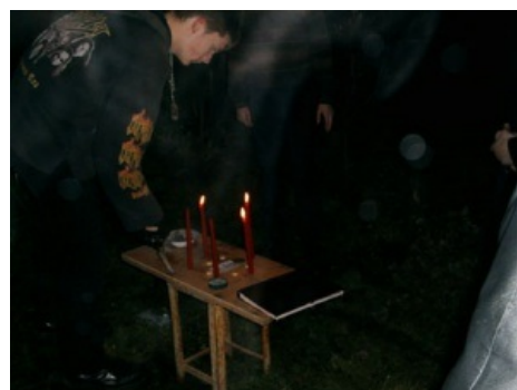
Ацкей ритуал уничтожения врага.