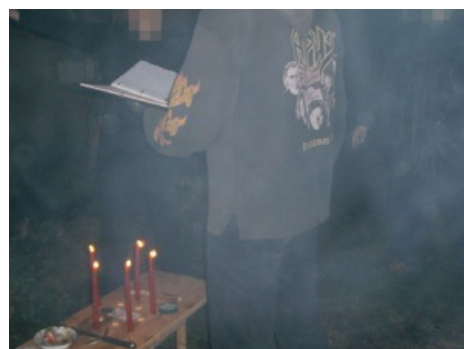
Валарат читает заклинания.

Настоящий сотонинский ритуал, заснятый Валаратом и выложенный в сеть