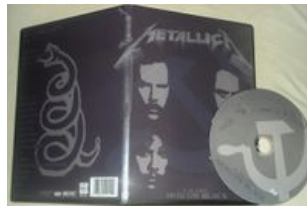
Metallica Live DVD Moscow 1991, Rare Concert Black Album