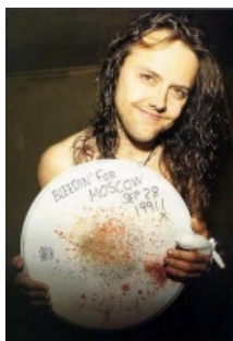
Ларс истекает кровью за метал!