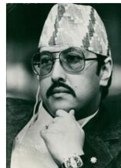
Он ещё не знает, что его пристрелят.

В 1990 году активизировалось массовое Движение за восстановление демократии, основными участниками которого был Непальский конгресс и коммунистические группы. После нескольких месяцев ожесточённых столкновений на улицах Катманду, в которых погибло более 800 человек, король Бирендра попытался замять бурление говен: Распустил панчатскую систему, легализовал политические партии и отказался от абсолютной власти. На выборах 1991 года Непальский конгресс получил 37,7% голосов, три коммунистические группировки – 36,5%. Правительство возглавил председатель Непальского конгресса; в правительство вошли представители коммунистов. Тогда же большинство марксистских группировок объединились в Коммунистическую партию (единую).