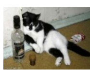
И животные тоже