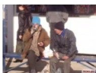
Пей до дна