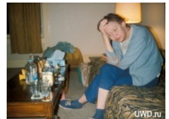
Пить или не пить? — вот в чём вопрос. Результат немного предсказуем

Женский вариант алконавта, имеющий однако отличия от мужского. Обладает воистину мистической способностью скрывать от окружающих свое пристрастие, причем иногда делает это настолько успешно, что даже близкие родственники не сразу догадываются о её пристрастии к зелёному змию. Упитый в сопли алконавт при малейшей провокации запросто устроит или полезет в драку, даже если всем очевидно что он сейчас получит по полной, пойдет туда, куда в трезвом состоянии никогда не пошёл-бы. «Пьяному море по колено», вобщем поведение алконавта в целом вполне предсказуемо. Поведение же алкоголички непредсказуемо совершенно: может из-за внешне совершенно невинной фразы вцепиться и расцарапать морду, а может полезть обниматься и целоваться а то и настойчиво потребовать взять ее во все дыры. Если же мужик внемлет её требованию «взять во все дыры», то непосредственно во время процесса взятия, внезапно безо всякой видимой причины может закатить истерику с воплями «Помогите, насилуют!», брыкаясь руками и ногами. Короче сложно понять что у неё сейчас на уме и что придёт в голову в следующий момент. Половые связи крайне беспорядочны, поскольку мужик поняв с кем имеет дело, такую женщину сразу бросает. Впрочем, если мужик сам является алконавтом, то вполне возможно возникновение устойчивой пары из совместно бухающих алконавтов.