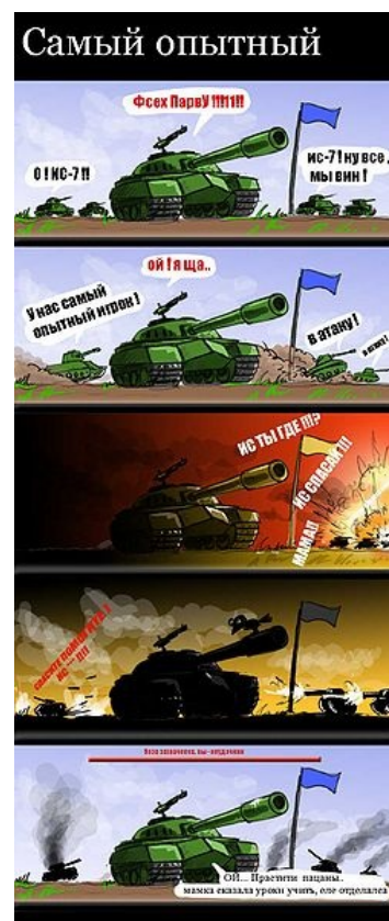
И такое бывает.

Приходят в игру с одной целью — ногебать. Активно вливают реал в прокачку, снаряды и расходники, качают ту технику, которая (по словам форумных экспертов/гуру) ногебается. После прокачки вайнят, что не ногебается (прямые руки за реал не купишь). После патча с очередным ребалансом срут кирпичами, заваливают форум воплями и качают новых ногебаторов, чтобы продать их после следующего патча. Основной источник заработка разработчиков.