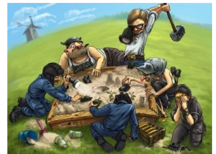
Суть™ игры для самых маленьких