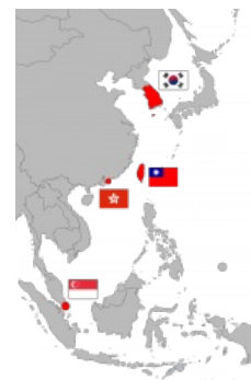
РК, Сингапур, Гонконг и, собственно, Тайвань

Тайваньские инвесторы и предприятия стали главными поставщиками инвестиций в Китае, Вьетнаме, Таиланде, Индонезии, на Филиппинах и в Малайзии. Из-за консервативной и стабильной финансовой политики. Центрального банка Китайской Республики и предпринимательских мощностей Тайвань мало