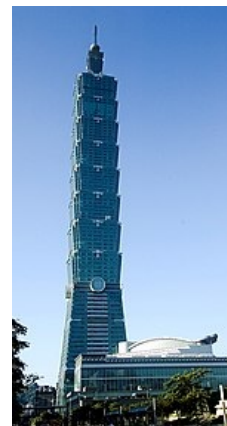
МПХ на 101 этаж, ёпрть!!!111

ЯННП(спойлер: Эт такая система у Тайваня, очевидно же)