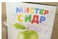
Сферический Мистер Сидр в вакууме