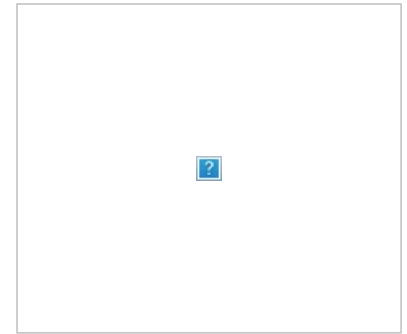
Конструкция взрывателя суровой русской бомбы из книги

Книга запрещена, при обнаружении ментами можно если и не получить уголовный срок, то условный очень даже можно, хотя в Федеральный список экстремистских материалов данный текст не входит. Понятно, что книгу запрещают вовсе не из-за террористов, кому надо и так знает всё, что необходимо безо всяких там «Поваренных книг», запрещается она, чтобы малолетний пиротехник случайно не подорвал ненароком самого себя или ещё кого-нибудь и чтобы потом не пришлось собирать кусочки состоявшего героя вперемежку с кусочками соседей по квартире по всему микрорайону. Причина, по которой та самая шпана любит подобные книги довольно проста — петарды давно надоели, кроме шума они ничего больше не производят, а увидеть собственноручно устроенный настоящий а не киношный взрыв очень уж хочется, да и повод похвастаться перед одноклассниками это даёт. Вот и химичат они по всяким «поваренным книгам» в надежде на то, что у них наконец получится что-нибудь действительно