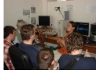
Оставь лишний креатифф, рассейский девелопер!