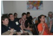
Номад и Бобик радуются