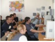
Критический предосмотр объекта критики.