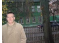
На фоне ныне снесенного бабушкиного дома. То самое каноничное фото