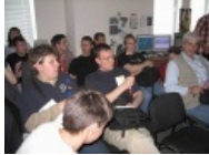
Покрасневший Номад и Бобег сделали вид, что не видят нагло наставленного объектива фотоонаниста- анона