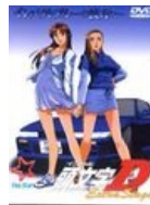
Обложка DVD OVA Extra Stage 1