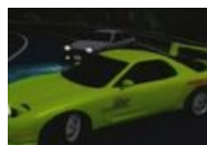
Один из кульминационных моментов первого сезона - Дуэль Такуми (на Тойоте) с Кэйсукэ Такахаси (на Мазде RX-7)