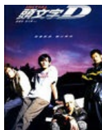
Обложка гонконгского издания фильма