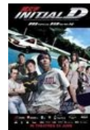
Постер кинофильма с китайскими актёрами