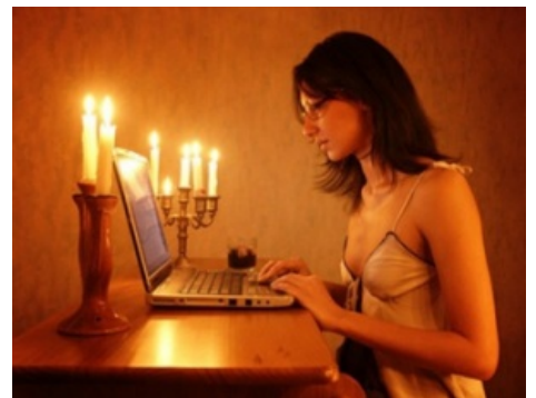
Ужин при свечах