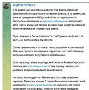
Турчак и кувалда

https://urbanculture.gay/images/5/55/Progozin_kuvalda.mp4