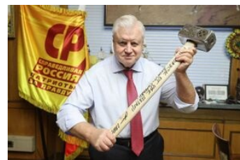
Миронов хвастается подарком от