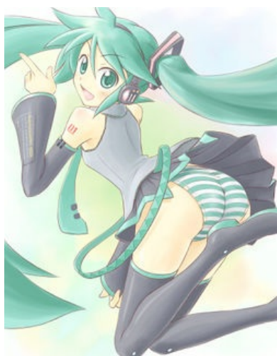
Каноничный вариант панцшота.

Мику — первый японоязычный войспак программы Vocaloid 2-го поколения, самый популярный маскот и практически синоним слова «Вокалоид». Характерные атрибуты — неги (лук-батун, она засветилась с ним в переделке видео Loituma Girl ) и белые панцу в циановую полосочку.