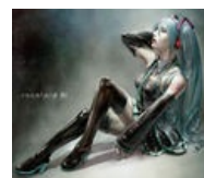
Реалистичное псевдо-3D изображение