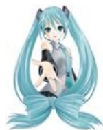
Нововеровское изображение, 2009 год