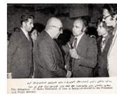
Решил прогнуться под