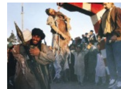
Наджибулла got pwned by Taliban.

Пиздец подкрался незаметно. Набрав силы, талибы двинулись на север, устраивая другим моджахедам и правительственным войскам полнейший экстерминатус. В 1996 они без боя взяли Кабул, повесив Наджибуллу и его брата. В итоге единственной силой, сумевшей оказать талибам серьёзное сопротивление, оказался Северный альянс, поддерживаемый не только бывшим врагом — СССР, который ушёл в историю, но и, собственно, Рашкой. Едва захватив власть, моджахеда перессорились. Многие командиры были недовольны постами, которые они получили. Вследствие чего, столица Афгана(Кабул) с весны 1992-го года стала ареной ожесточенной вооруженной борьбы за власть.