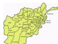
Это админка. Алсо вышеупомянутый Панджер, который Масуд должен был удержать.

Потом ввели сухопутные войска. Проблема заключалась одна: Выпилить всех талибов оказалось нереально. В добавок с каждым убитым духом, который нередко параллельно является ещё и кормильцем какой-нибудь семьи, практически всегда из-за всеобщей нищеты появляется какой-нибудь отец/сын/брат/сват (а то и все вместе), желающий отомстить проклятым неверным, ибо другого выхода, кроме как разве что сдохнуть от голода, у него нет. Хотя нельзя не отметить, что одним из источников доходов талибов является взимание дани с местного населения на подконтрольных территориях, что в условиях нищеты и фактической бесконтрольности действий талибских полевых командиров нравится далеко не всем.