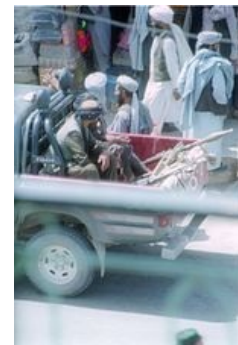
Эти ребята потом окажутся умнее всех.

Причиной такого единения стало появившееся у всех устойчивое чувство, что что-то нехорошее грядёт вместе с фанатиками «Талибана». Да и повод помириться неплохой — давайте вместе бить талибов, ёпт! Несмотря на помощь, Северный альянс был оттеснён талибами на тот самый север, после чего гражданская война перешла в вялотекущую позиционную стадию на целых 10 лет, а Ахмад Шах Масуда благополучно выпилили с помощью заложенной в телевизионной камере взрывчатки арабские наёмники.