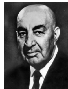
Уже диктатор и даже хитрый план сколотил.

Но не все совковые партократы в 1973 году были такими же маразматиками как Леонид Ильич Брежнев , и вскоре прекратили помогать развитию маленькой, но очень гордой пуштунской республики. Обстановка накалялась, военные заговоры с целью свержения возникали то слева, то справа, и в итоге разгневанный президент явился в 1978 году с требованием продолжить вливание сотен нефти хрен знает во что, обмолвившись, что «союзником СССР он не является». Естественно, хама выставили на мороз, за что по приезде на Родину он отправил к праотцам представителя коммуняка. Похороны переросли в демонстрацию под красным флагом, а попытка подавить демонстрации и посадить лидеров компартии — ВНЕЗАПНО — к военному перевороту,