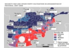
Талибы знали толк в гешефтмахинге. Нет, серьёзно.