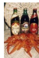
Расово-верный натюрморт с членистоногими