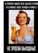
Рецепт для офисного планктона