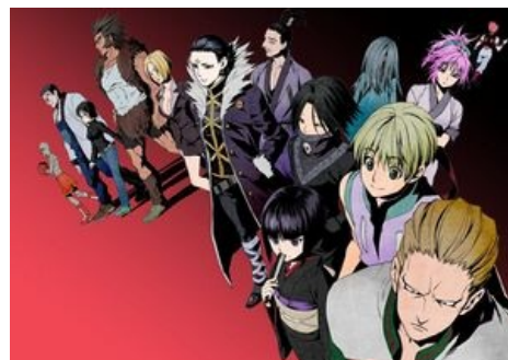
Или может это?