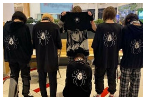
Собственно неуловимый Рёдан