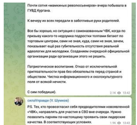
Российский губернатор предложил отправлять предводителей «мамкинских революсьенеров» на войну на Украину «вне очереди»