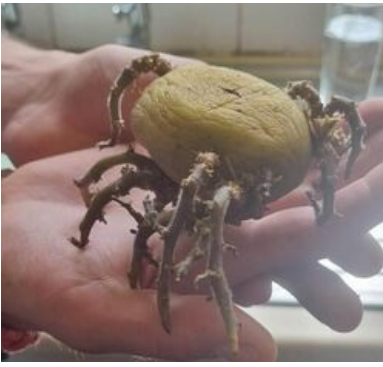
Редан, белорусская версия

https://urbanculture.gay/images/9/9e/Redan-bel-1.mp4