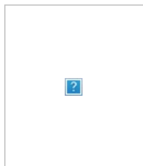
Никколо Паганини. Гравюра 19 века.