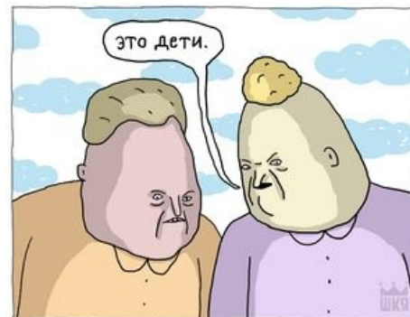
Типичные персонажи ШКЯ