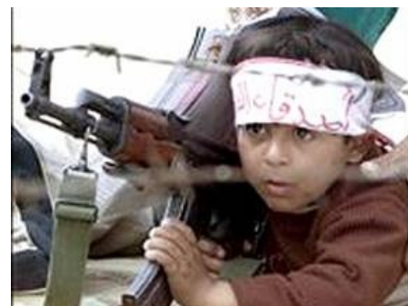
Нет, этот за аятоллу не воевал.