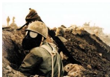
А это хлором травили