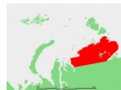
Таймыр, сферический в вакууме.

января был официально назначен в состав экспедиции. Начальник экспедиции предложил ему руководить гидрологическими работами, а также исполнять обязанности помощника магнитолога. Всю зиму и весну Колчак готовился к экспедиции: прошёл специальный курс и практику в Главной геофизической обсерватории (Петербург) и Павловской магнитно-метеорологической обсерватории, совершил командировку в Норвегию для консультации с Ф. Нансеном, в течение некоторого времени проходил у него стажировку. Кроме того, он участвовал в комплектовании команды.