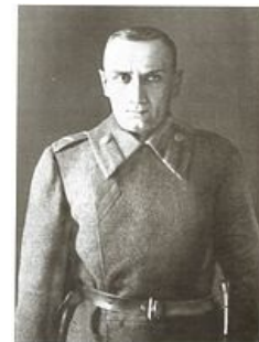
Так всё-таки и вышло.