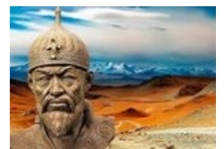
Гастарбайтеры всей СНГ-шной Азии ждут своего кумира.

В те времена в Средней Азии было неспокойно — на каждом квадратном месте находилось независимое мини-государство, которое не только флюородросило своим соседям, а постоянно вело войны с ними. Тимур, быстро смекнув , что этим можно воспользоваться в свою пользу, особенно ярко продемонстрировал свою преданность местному царьку и уже через год был назначен помощником монгольского царя Ильяс-Ходжи. Однако скоро Ильяс понял, что под боком растет не послушная овечка , а жадный до власти начальник военной службы . Приняв решение выпилить потенциально опасного конкурента, Ильяс-ходжа обратился к услугам наемников, но вовремя узнавший об этом Тимур смог так свалить из страны . Руководствуясь принципом «враг моего врага — мой друг», Тимур перешел на сторону врагов Ильяс-ходжи, а именно к эмиру Хуссейну . В одном из сражений против сторонников Ильяс-ходжи, вся армия эмира была перебита и в живых остались лишь Хуссейн и Тимур. Недолго думая, два товарища отправились в районы Амударьи и начали партизанить против войск Ильяс-ходжи. В одной из таких стычек Тимур лишился двух пальцев на руки и получил удар клинком в правую ногу. В дальнейшем, хромота стало его визитной карточкой.