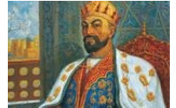
Во истину тюрк.

Полководец Тимур ибн Тарагай Барлас ( чагат. - Tāmūr ibn Tāraḡaiyi Bārlās) aka Тамерлан - полководец, РЕВНОСТНЫЙ воин Аллаха, жестокий завоеватель, почти Суворов (не дотянул, слил один единственный махач против внука Чагатая) любитель отрубать головы и просто хороший человек, создавший в XIV веке империю, занимавшей 1/3 Евразии, не смотря на то, что он опоздал на карнавал отца всех чингизидов где-то на 100 лет, и ВНЕЗАПНО(!) де-факто создатель той России, которую мы потеряли. Прожил 69 лет, когда в 1405 году решил прилечь и больше не проснулся. Как и многие другие, оставил после себя много вопросов, являющихся неотъемлемыми составляющими серии былинных спецолимпиад . Корни Тамерлана уходят к монголам, но на момент его рождения, это были уже земледельцы, осевшие на территории Средней Азии и ассимилировавшиеся настолько, что разговаривали исключительно на тюркском языке и считали монголов-кочевников врагами number one. Сам Тимур относился к своему непонятному происхождению весьма прохладно , что не помешало ему выучить к 20 годам помимо тюркского еще и монгольский с персидским. А вы говорите, что выучить English это испытание?