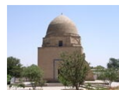
100% воен Аллаха.

В результате монгольских походов тысячи учёных, юристов были убиты, сотни медресе разрушены. Тимуру пришлось приложить огромные усилия для восстановления системы высшего образования и особенно мусульманской юриспруденции. Пришлось приглашать в столицу государства крупных мусульманских правоведов, например, Сад ад-дини Масуд ибн Умара ат-Тафтазани (1322, Тафтазан, Хорасан — 1393, Самарканд) видного представителя позднего калама. Его сочинения по логике, юриспруденции, поэтике, грамматике, математике, риторике и коранической экзегетике пользовались популярностью в качестве учебных пособий. В начале XV века в Самарканде работал и преподавал такой крупный учёный-правовед как Шамс ал-Дин Мухаммад б. Мухаммад ал-Джазари.