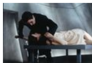
О да, он знает как обращаться с женщинами.