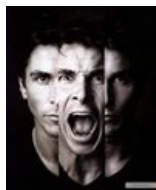
This is TETRAGRAMMATON