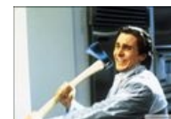
Но если и зарубит, то только от избытка чуйств.