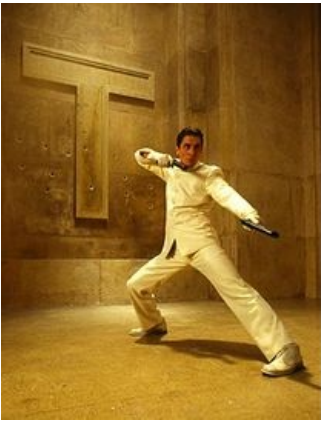
Ган-ката. +10 к пафосу, -50 к реализму.

заезженность идеи, кое-чем фильм все же оказался хорош: