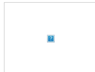
Пила смотрит на тебя, как на очередную жертву. Берегись!

Самый страшный ужастик если не в истории жанра, то за последние пару десятилетий это точно. Маньяк устраивает жертвам игру на выживание. Чтобы выжить в игре, надо совершить что-то довольно мерзкое, например конкретно искалечить себя или другую жертву. Жертвы выбираются не случайно, а те, кто в прошлом жил неправильно, с точки зрения Пилы. Обычно это злодеи, избежавшие суда, или неудачники. Пила — смертельно больной человек, который начал ценить жизнь только когда столкнулся со смертью, этим же он наставляет других на «путь истинный». Прошедшего маньяк честно отпускает на свободу, считая что теперь этот человек заслужил право на жизнь, проигравший помирает в мучениях. Разумеется сюжет построен так, что до конца фильма испытаний не может пройти почти никто. Фильм построен на флешбеках в лучших традициях детективного жанра, очередные ответы (и ещё больше новых вопросов) зритель получает в самом конце очередного фильма.