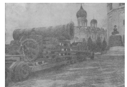
Тащут в Кремль

Царь-пушку долгое время таскали туда-сюда. Как уже говорилось выше, сначала её поставили на Лобном месте, после перенесли внутрь Кремля в здание Арсенала. После вытащили и установили рядом на декоративный лафет и положили рядом две стопки ядер. И лишь при советской власти, в 60-х, вынесли на Ивановскую площадь, где она стоит и сейчас.