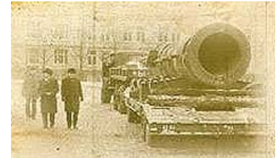
Увозят на реконструкцию

Кому верить — решайте сами, споры ведутся до сих пор.