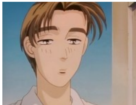
... и сонный, ...