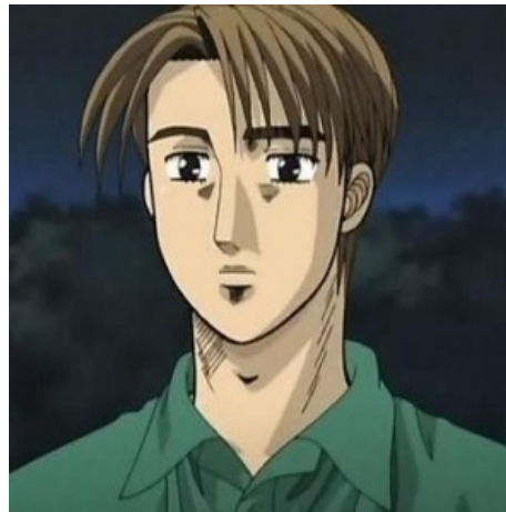
ОЯШ Такуми Фудзивара такой обыкновенный...

В первом сериале (носящем неофициальный подзаголовок «First Stage») происходит становление Такуми как про-стритрейсера, в последующих тайтлах его талант прогрессирует.