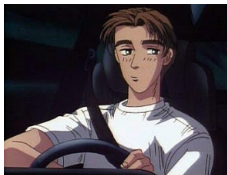
..., пока в машину не сядет.