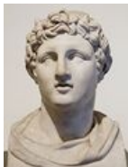
Сын и карманный Филя 3. козырь Монофтальмуса, Деметрий Полиоркет.