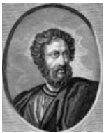
Пердикка, такой Пердикка.