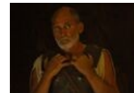
Полиперхон, тоже из вышеупомянутого кинца.