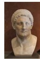
Птолемей Сотер тоже смотрит на Пердикку, только как свиборг.