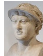
Ему ещё стоит проебать сынам Ромула.