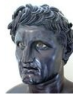
Селевк смотрит на Пердикку, как на говно.