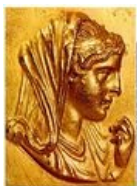
Мамаша Саши 3 от эпидемии ФГМ не отставала.