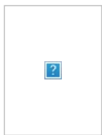
Илья Мэддисон на фоне солнца.