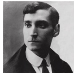
Обычный португальский школьник.

28 апреля 1889 года в семье управляющего поместьем Антониу Оливейры-старшего и его жены Марии ду Резгати Салазар родился замкадышный задрот, наречённый в честь отца. Он был пятым ребёнком у супругов, возраст которых приближался к пятидесяти. Детство Антоши прошло в живописном и практически оторванном от мира посёлке Вимиейру, расположенном в 75 км от Лиссабона. Антониу-старший и Мария были счастливы — до этого в семье появились 4 дочери, сына ждали долго, с ним связывались большие планы и честолюбивые надежды. Родители решили дать ребёнку католическое образование: выросшие ещё до эпохи индустриального бума в Португалии и практически всю жизнь прожившие в маленькой деревне, они были очень консервативны и воспитывали сына в таком же догматическом духе, что повлияло на полит-взгляды сабжа. Родители любили будущего вертухая-задрота и, несмотря на бедность, не жалели средств на его образование. Салазару удалось поступить в католическую школу в городе Визеу, а спустя некоторое время выдержав вступительное испытание в католическую семинарию. Религиозное образование подходило и характеру будущего политика. Сам он вспоминал, что «жил, полностью поглощённый своими мыслями и работой, и был серьёзным и думающим мальчиком».