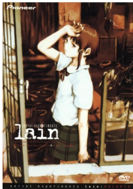
Serial Experiments Lain.

Truefrit: Насмотришься "Эксперименты Лэйн", выходишь на улицу мусор выносить - а там везде ПРОВОДА.