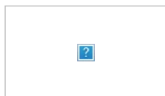
А это злой и голодный.