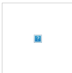
Йода знает толк в троллинге.