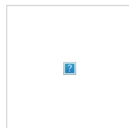
Те самые альбомы

Альбомы срубили одинаковое количество бабла а если умножить это число на количество участников то получим схему. Профит \times 4 = \text{Профит}4! (не считая пятого)